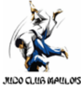
JUDO CLUB MAULOIS

Les cours de judo ont lieu au Gymnase CHARPENTIER (près du collège).