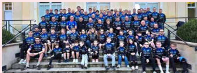
Dernière remise de maillots en février 2025

- Augmenter l'effectif école de vélo. - Continuer à avoir une équipe compétitive en minimes cadets. - Constitution d'une équipe féminine en 2026 en complément de notre équipe accès et open 3. - Continuer à organiser chaque année une dizaine de courses.